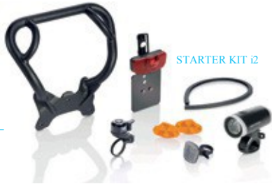
STARTER KIT i2